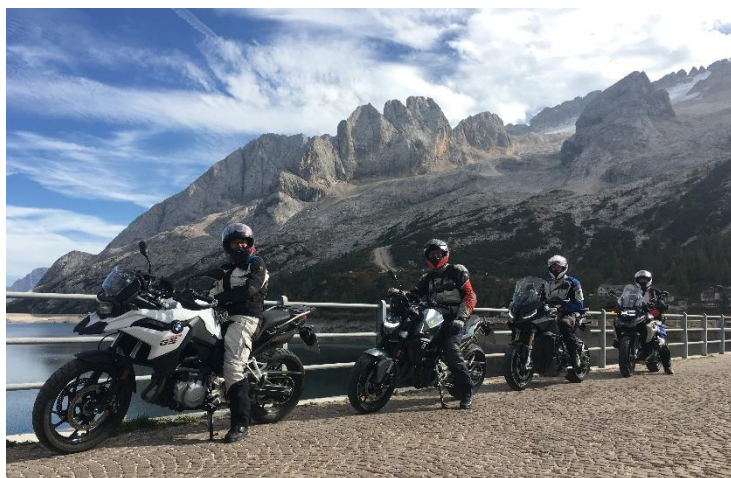
Foto 2: Last Ride of the Season