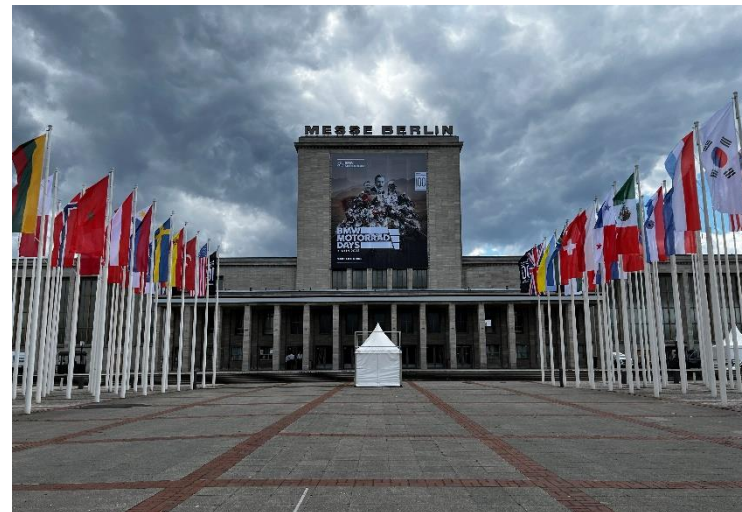
Foto 4: BMW Motorrad Days Berlino