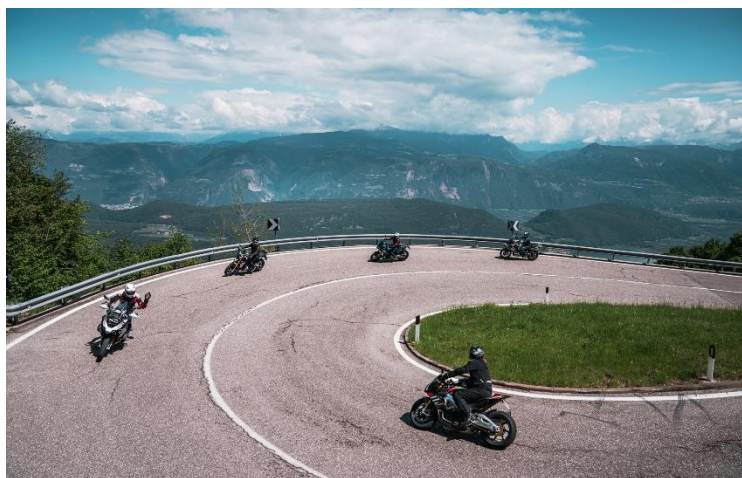
Foto 1: Programma 1 giorno Onroad – Passo Mendola